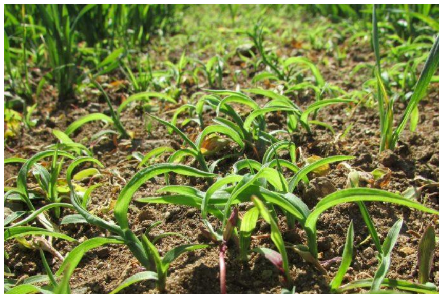
Ung hønehirse.

Bekjempelse av hønehirse vil også være tema på markvandring med Halden Bondelag 3. juni. Hold av eften 3. juni!