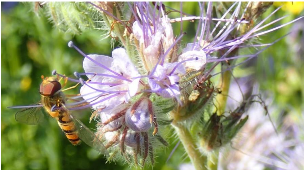
Honingurt med blomsterflue.

Les også fagartikkelen: Tilrettelegging for pollinerende insekter fra NLR.