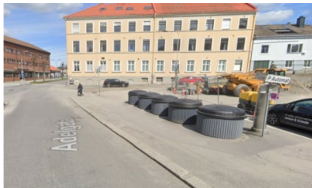
FIG. 2 – SEMINEDGRAVDE BEHOLDERE I ADELGATA. HER ER EN UTFORDRING AT ANDRE ENN BEBOERNE SELV BENYTTET BEHOLDERNE.