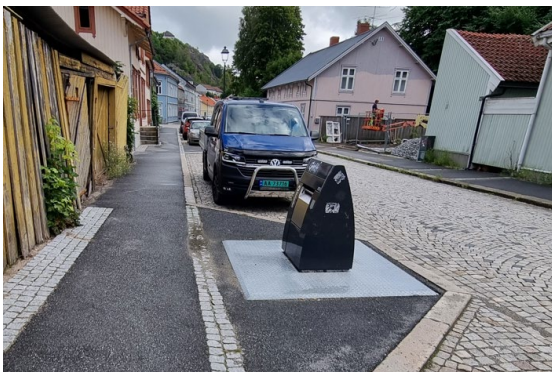
FIG. 1 – NEDGRAVD LØSNING I DAMHAUGGATA

Til nå har flere borettslag også etablert nedgravde løsninger, særlig pga. brannhensyn. Lilletorget er et vellykket eksempel på et område med nedgravd løsning. Her er det benyttet helt nedgravd løsning, tilsvarende som på Damhaugen, men med ozon-generator som forhindrer lukt. Renovasjonsavdelingen mottar få klager på de nedgravde løsningene.