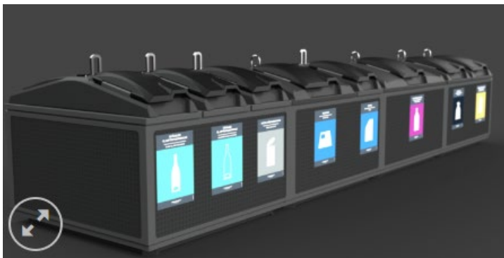
FIG. 4 OG 5 EKSEMPLER PÅ OVERFLATEBEHOLDERE

I de sentrale deler av byområdet, med NB-områder (kulturhistoriske områder av nasjonal betydning) vurderes helt nedgravde fellesløsninger å være et estetisk bedre alternativ enn seminedgravde løsninger og overflatebeholdere. Helt nedgravde løsninger er også sikrere ut fra brannhensyn.