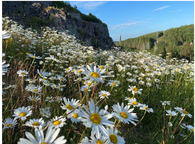
Du kan blant annet søke SMIL-midler for å fremme biologisk mangfold.

SMIL – obligatorisk vedlegg til utbetalingsanmodningen